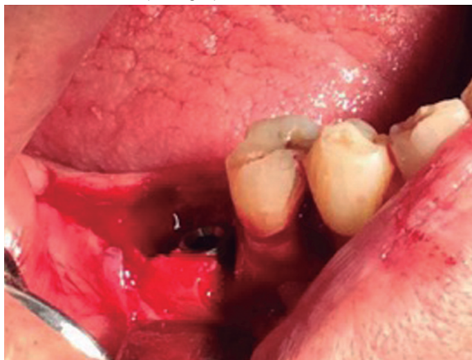
Figura 1. Implante dental NORMON HI inmediato después de extracción dental de OD#46; se observa además el espacio alveolar restante alrededor del implante.

bola huevo, para no afectar la vascularización; finalmente se hizo sutura simple, colchonero y en cruz. Se recetó Augmentine 500mgs (amoxicilina con ácido clavulánico) cada 8 horas durante 7 días, paracetamol 1g cada 8 horas durante 4 días y Perio Aid Clorhexidina 0,12%, 10ml cada 12 horas por 15 días. El procedimiento finalizó sin complicaciones y la ortopantomografía final evidencia la correcta colocación del implante dental, con buen paralelismo, mediante el uso de referencias intrabucales como el OD# 45, y adecuada distancia entre diente-implante, de 1.5mm en sentido horizontal (Ver Fig. 2)